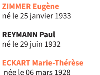
ZIMMER Eugène né le 25 janvier 1933