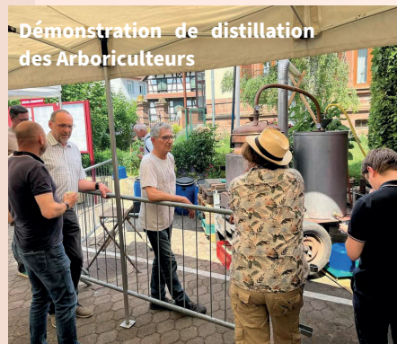
Démonstration de distillation des Arboriculteurs