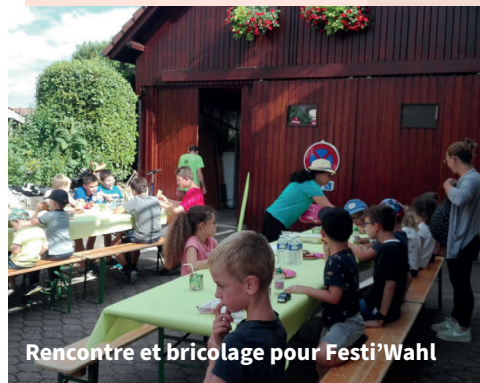
Rencontre et bricolage pour Festi'Wahl