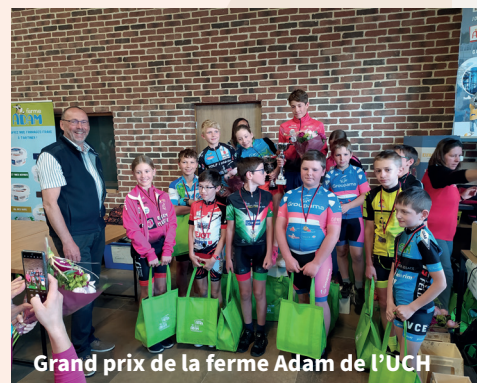
Grand prix de la ferme Adam de l'UCH