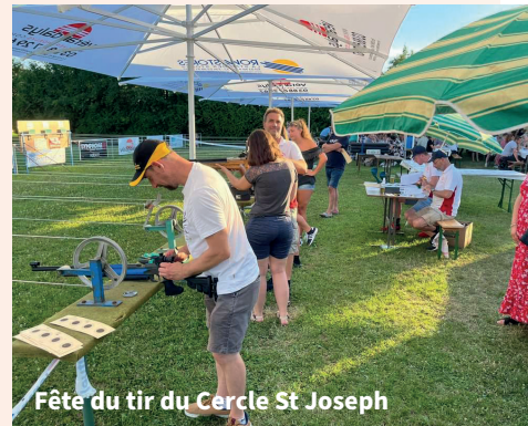
Fête du tir du Cercle St Joseph