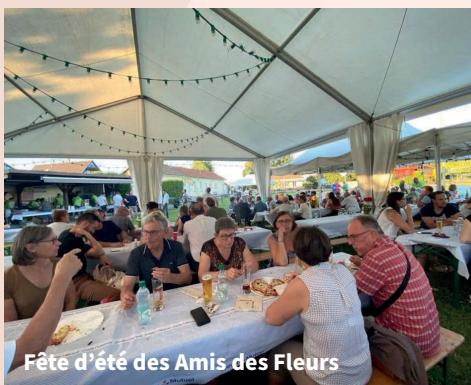
Fête d'été des Amis des Fleurs

Vous étiez nombreux à attendre ce retour à une vie sociale normale. Un grand merci à tous ces bénévoles pour leur engagement. Retour en image sur ces différents événements.